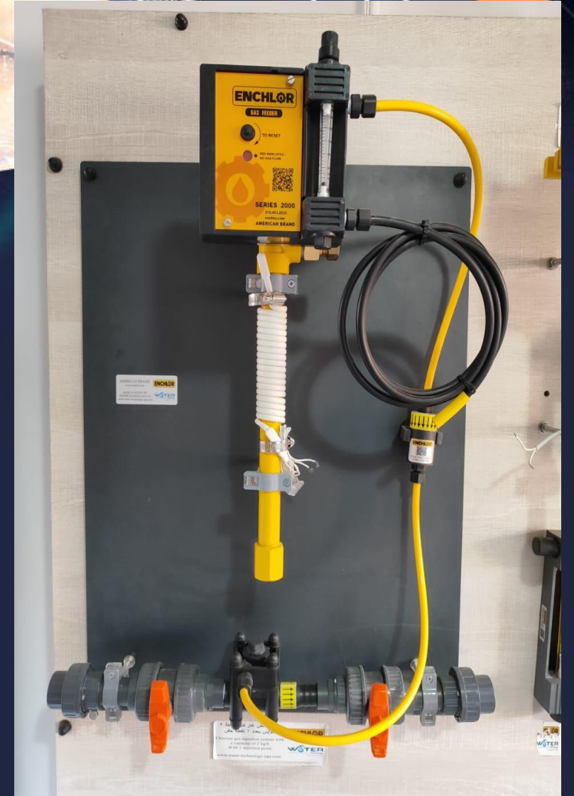
منظومة حقن كلور سعة 2 كجم/س لعدد 1 نقطة حقن