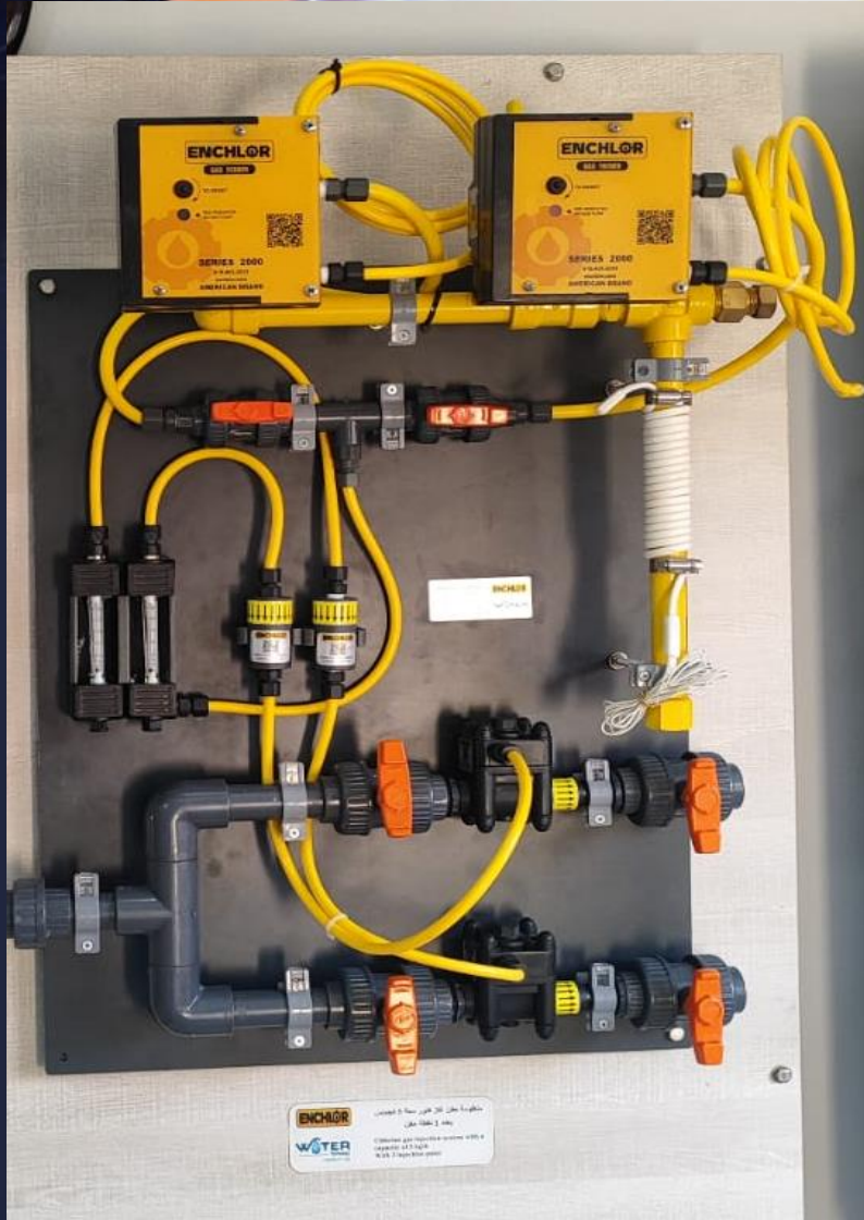
منظومة حقن كلور سعة 5 كجم/س لعدد 2 نقطة حقن